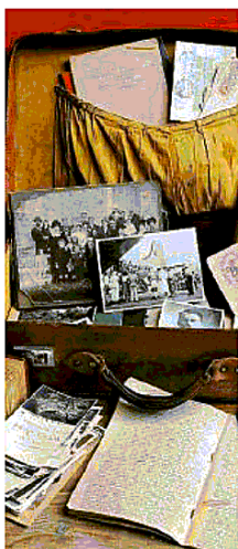
COPERTINA Nuovo romanzo

Si parlerà della lungimiranza politica di Pinuccio Tatarella (1935-1999) in un incontro promosso dal Circolo di Fratelli d'Italia di Gallipoli in programma oggi, alle ore 17.30, nel Joly Park Hotel. L'occasione sarà offerta dalla presentazione del libro che raccoglie alcuni suoi scritti - intitolato "La destra verso il futuro - Itinerario di una svolta", edito dalla Fondazione Tatarella con prefazione di Giorgia Meloni. Moderatrice Marzia Tarantino, interverranno all'incontro: il nipote di Pinuccio Fabrizio Tatarella, il coordinatore di FdI onorevole Saverio Congedo e il consigliere regionale di FdI Antonio Gabbellone. A Tatarella, che tutti ricordano come "ministro dell'armonia" nel primo governo Berlusconi di cui era anche vicepresidente del Consiglio, si attribuisce il percorso di trasformazione dal Msi-Dn ad An che portò alla nascita della Destra di governo. [g. alb.]